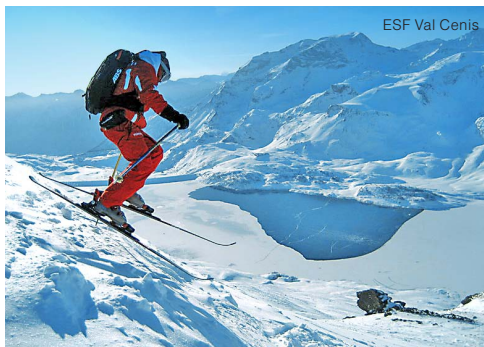
ESF Val Cenis